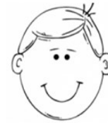
Ова момче е од Македонија. Тој е Македонец. Што му се допаѓа повеќе?

Резултатите од истражувањето во Македонија покажаа значајна врска меѓу годините на децата и нивното препознавање на социјалните ознаки кои припаѓаат на една или друга заедница.